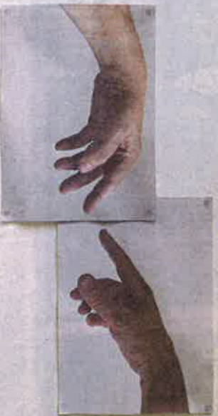
Mark Wallinger, Ego