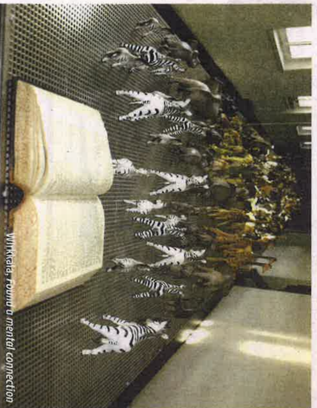
Wirkkaler, Rowina u mental connection

Wie kam Ihnen die Idee zur Ausstellung? Welche konkrete Verbindung hat diese zum Lutherjahr, das 500 Jahre Reformation reflektiert?