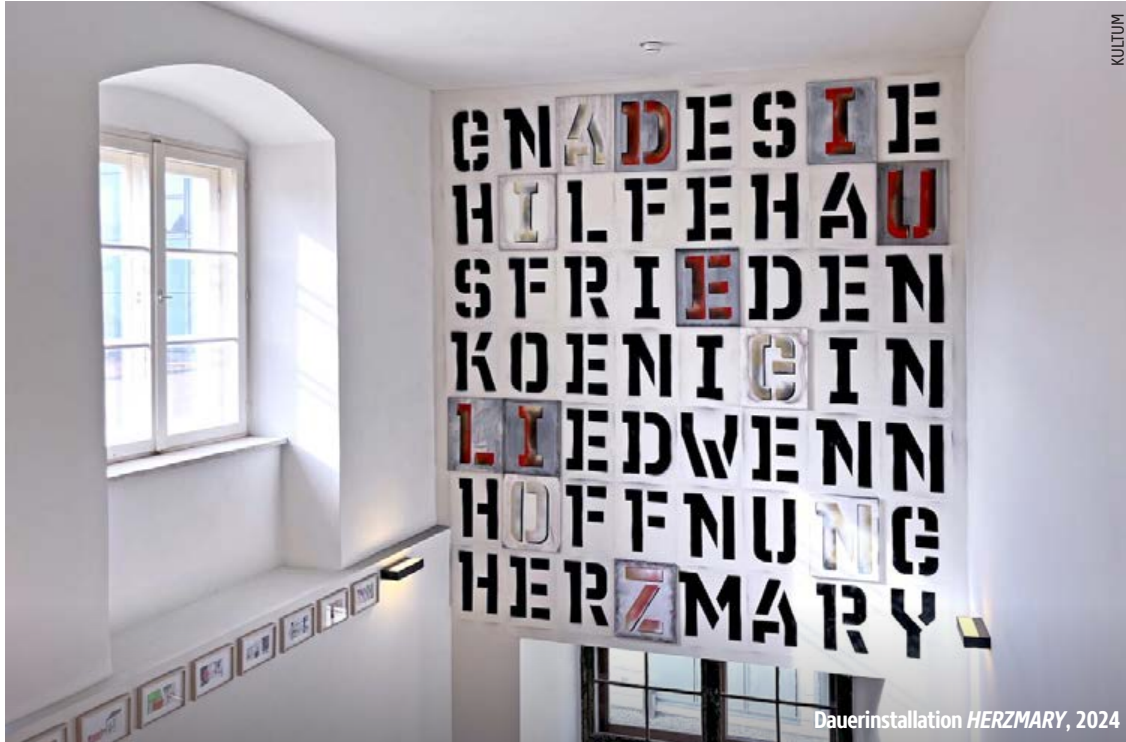
Dauerinstallation HERZMARY, 2024