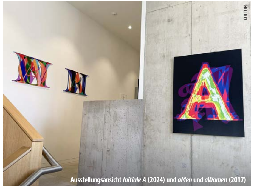
Ausstellungsansicht Initiale A (2024) und aMen und aWomen (2017)

Eine sehr umfangreiche Schau im neuen Museumszugang des Kultum bietet Einblick in die Arbeitsweise des Künstlers Michael Endlicher, der Buchstaben, Sprüche und Zahlenspielerien in seine Kunst verwebt.