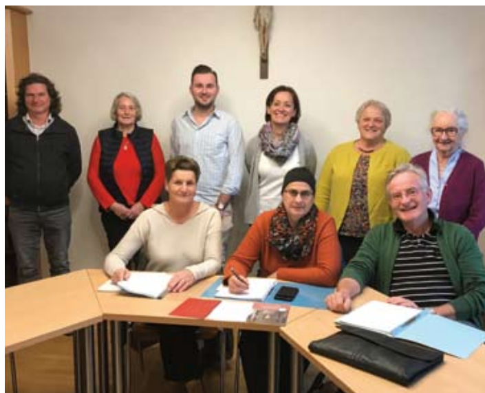
Foto vom 2. Kurstag am 16.11.

Die Teilnehmerinnen und Teilnehmer beim ersten Kurstag. Praktischen Aufgaben und Üben gehörten zum Kursinhalt.