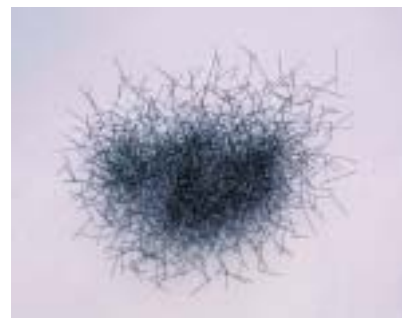
Antony Gormley, Quantum Clouds XXVI (sleeping figure), 2000; stainless steelbar, 4 x 4 mm, 180 x 182 x 97 cm, Courtesy Galerie Thaddaeus Ropac, Paris

werfen: In einer gewissen Weise, könnte man sagen, macht der Betrachter die Arbeit für mich.