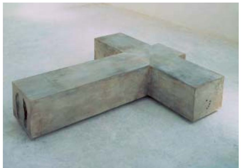
Antony Gormley, Flesh , 1990, Concrete, 360 x 1980 x 1740 cm, Courtesy Salvatore Ala Gallery, New York

Und dann passierte eine einschneidende Weiterentwicklung am Ende der 90er Jahre, als ich bei meinem bisherigen Werk ein Gefühl der Begrenzung empfand. Ich wollte von nun an über den Körper, und nicht bloß über ein Ding sprechen, ihn weder bloß als einen Ort, noch als ein Objekt charakterisieren, sondern als Prozess. Dies war der Beginn der „Quantum Clouds“, einer Serie von Skulpturen, die versuchen, in gewisser Weise eine Keimzelle zu definieren, das Eigentliche des Körpers als einen Ort der Transformation zeigen. Die Figur zeigt sich als skulpturale Evokation einer Welle, die den Raum des Kör-