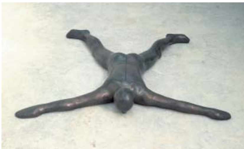
Antony Gormley, Close I , 1992, Lead, fibreglass, plaster, air, 25 x 192 x 186 cm, Courtesy Galerie Thaddaeus Ropac, Paris

A.G.: Ich bin über die Redeweise des Symbols in meiner Arbeit nicht glücklich. Der Körper ist für mich kein Objekt, er ist ein Ort. Vielleicht ist dies vorab das Wichtigste, was ich sagen möchte: Ich empfinde meine Existenz als eine Art Raumerforschung. Ich benütze meinen eigenen Körper als das erste Material, als ein Werkzeug, als ein Instrument dieser Erkundung – und als ein Subjekt. Aber ich benütze meinen Körper, weil es der einzige Körper ist, den ich belebe. Er ist das Nahste der materiellen Welt zu meinem Bewusstsein. Nicht weil er etwas Besonderes wäre, er ist einfach da, er ist das Einzige, mit dem ich aus einem Freiheitsaxiom heraus arbeiten kann, er ist der einzige Punkt der Freiheit, den wir in Wahrheit augenblick-