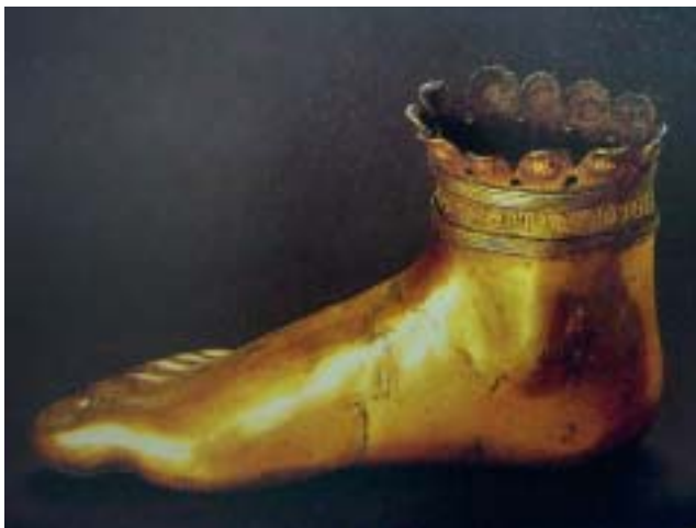
St. Allard's Foot, 1331, Reliquie

A.G.: Beholder's share, die Erfüllung des Werkes durch den Betrachter, der Betrachteranteil, all dies macht in meiner Arbeit vielleicht mehr als die Hälfte aus, weil die Arbeit immer in einer gewissen Hinsicht unfertig ist. Meine Skulpturen geben keine genauen Details zu erkennen, keine Attribute oder Gesichtszüge. Der Betrachter ist immer dazu angehalten, sich hineinzusetzen. Allerdings wird der Betrachter/die Betrachterin in diesen neuen Arbeiten auch eingeladen, im Sehprozess seinen/ihren Anteil selbst zu konstituieren und zu ent-