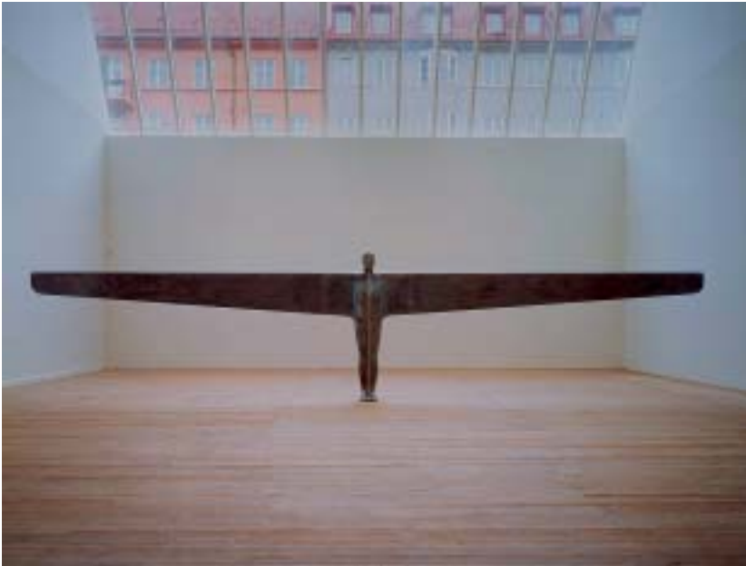
Antony Gormley, A Case for an Angel II, 1990, Plaster, fibreglass, lead, steel, air, 1907 x 8580 x 460 cm, Courtesy Galerie Nordenhake, Sweden