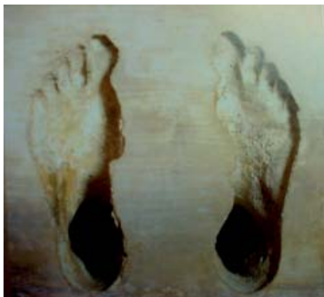
Antony Gormley, Flesh , 1990, Concrete, Detailansicht

K.u.K.: Deine Arbeit wurde einmal treffend als „psychologischer Kubismus“ des Innenlebens bezeichnet, du hast dich aber erst im Lauf der Werkentwicklung dorthin bewegt. Wie siehst du das selbst?