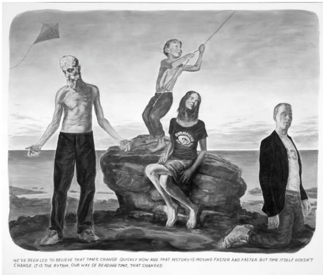
Muntean/Rosenblum, Untitled (We've been led...) , Painting, 2004, 220 x 260 cm