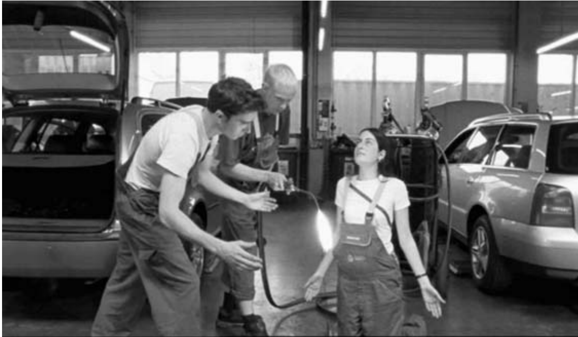
Muntean / Rosenblum, "Not To Be. Not To Be At All" (Videostills), 16:9, Audio, Pal, Loop, 2003, Courtesy Georg Kargl, Vienna

Die pathetischen Gesten dieser Mechaniker, die zu Standbildern gefroren sind, stammen unverkennbar aus der christlichen Bildgeschichte. Zu den getragenen Klängen religiöser Musik und zu einer Stimme, die Sentenzen jugendlicher Lebensschwere als unendliche Leere inszeniert, treten die Schauspieler im Vordergrund nach und nach ins Bild, während in der Auto-Werkstätte die Reparaturen erledigt werden. Durch das langsame Rotieren der Kamera gerät alles in Schwebelage: Es wird das Gefühl vermeintlicher Sinnlosigkeit („Not to be. Not to be at all“) im Leben dieser jungen Menschen evoziert; unklar bleibt, ob es sich um KFZ-Mechaniker oder Schauspieler handelt – ein Schweben zwischen Authentizität und Künstlichkeit. Am Ende des Loops wird unverkennbar an das Weihnachtsbild erinnert. „Maria“ hält ihre Arme offen und blickt erwartungsvoll nach oben, ein Mann („Josef“) hält den LötKolben als verfremdete Kerze in eine Mitte, die leer ist, ein anderer („Hirte“/ „König“) weist just darauf hin. Aber kein Kind ist da, niemand, den man anbeten kann. Die Gesten und Sprüche der jugendlichen Akteure halten der Lebenswirklichkeit nicht stand. In früheren Werkphasen des Künstlerduos sind es nicht nur Fotografien und Tafelbilder, sondern auch Live-Performances, die zu Tableaux-Vivants-Szenen gefrieren: In der