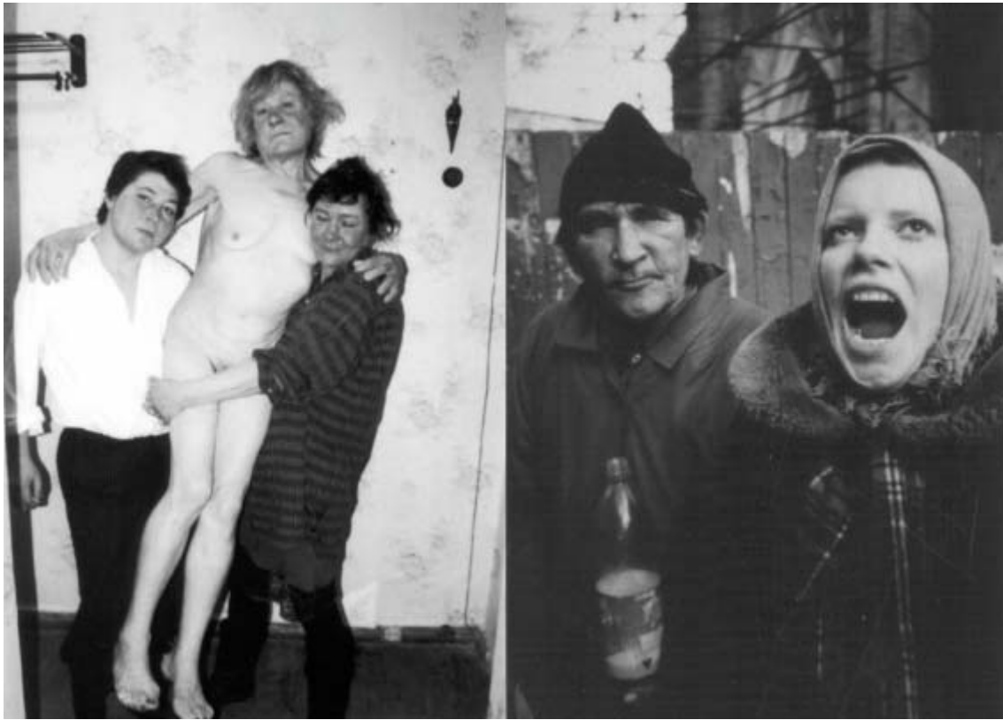
Boris Mikhailov, CASE HISTORY, Fotos, unterschiedliche Formate, 1999.

Beweinungsszenen und in der Darstellung von Trauernden vorbringt. 20 Solche Assoziationen sind zwar nicht die Antwort auf die Darstellungsform, aber senken sich nieder oder drängen sich auf.