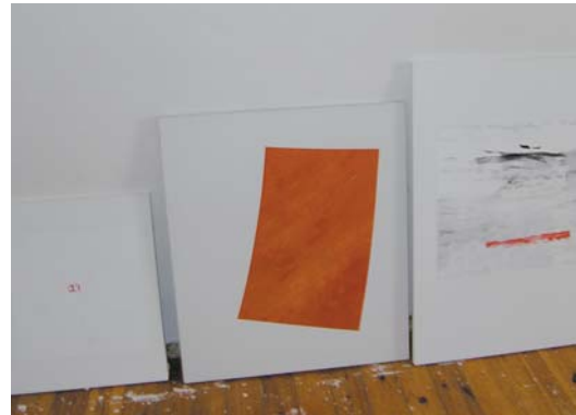
Im Atelier von Gerhard Lojen; Mitte: „Ohne Titel, 1990“, rechts: „Ohne Titel, G 4/ 05“