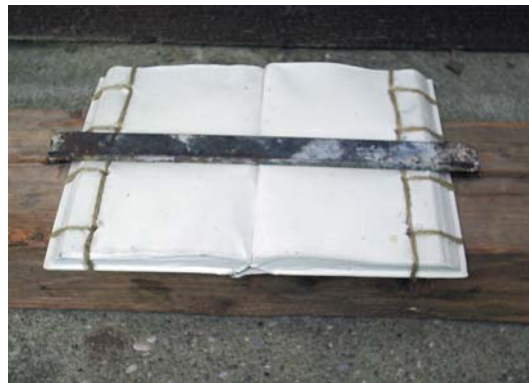
Gerhard Lojen, Buchobjekt, o. J.; Buch, Farbe, Holzstück, Eisenklammer, Spagat; 18,5 x 42,5 x 10,3

Man verbindet Weiß bei Lojen auch dort, wo es nichts verloren hat, und wo er Beuys am nächsten liegt: In seinen Büchern, besser: in den Objekten von Büchern. Von denen es unterschiedliche gibt, auch mit Farben bemalte, mit Gaze verbundene und „In Verbundenheit“ signierte. Aber meist sind sie durchstoßen mit großen Nadeln oder gebrannten Löchern und: irgendwie dann wieder zusammengeheftet, an einem Ort, der für Fadenheftung nicht vorgesehen ist. Bücher sind nicht nur Wissensspeicher bei Gerhard Lojen, sondern Bücher finden bei ihm, dem Gebildeten, eine Verehrung. Ein Buchobjekt dieser Hommage ist weiß getüncht und eingepfercht in der Zimmermannsklammer auf einem alten Trampfosten. Die Fadenbindung aus einem dünnen Hanfseil am Rand bildet schon ein grobes Korsett für das aufgeschlagene Buch, seinem Wissen und dem darin gespeicherten Denken. Die Einhüllung in Weiß steigert noch die Potenz. Aber die Klammer dieser Kreuzigung, die die Seiten flachdrückt, wird vielleicht nicht halten. Nicht nur der Hase, auch das Denken lebt. Ob übertüncht oder geläutert, im Weiß