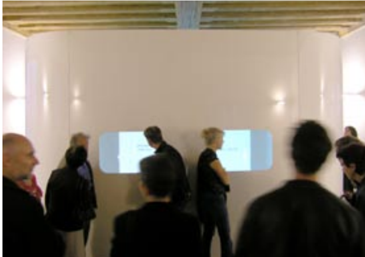
Der weißer Kubus im Foyer des Priesterseminars ist nicht nur innen animiert, sondern auch außen – beinahe wie ein Spinnennetz – überspannt.

Nicht nur als produzierender Künstler, sondern auch als rezipierender Betrachter muss man sich in die Dunkelheit begeben,