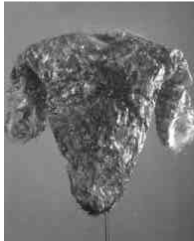
Paula Santiago, Moan, 1999.