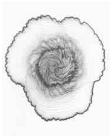
Davis Russel Birks, Spiral No.18, 2000

Durch die gesuchte Distanz zu jeglichen Eingenungen stilistischer und generischer Art versucht Davis Russel Birks, geboren 1957 in Seattle, USA, mit verschiedenen Projekten in seinen Zeichnungen, Skulpturen und Installationen eine kreativere Welt zu schaffen: als eine andere Möglichkeit der Antwort auf die tatsächliche Welt. Ab 1987, nach seinem Studium (B.F.A.) in Arizona, hat Davis Russel Birks u.a. in Mexiko, USA und in der Schweiz ausgestellt und zahlreiche internationale Preise erhalten.