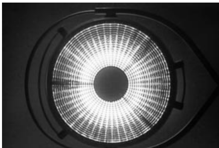
„Seeing Things“: Mark Wallingers Operationstischlampe wird zum Auge.

Im Wechsel zwischen Schärfe und Unschärfe suggeriert eine Operationslampe einen narkotischen Schwebestand. Dazu sprechen verschiedene Stimmen einmal zögernd, das andere Mal mit sicherem Klang Buchstabe für